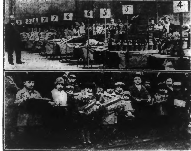
EN HAUT: Les tables garnies de jouets. EN BAS: Un groupe d'enfants ayant participé à la distribution.

Comme chaque année, La Fraternelle des Anciens Combattants Roubaisiens a fait procéder dans la vaste salle des fêtes de la rue de l'Hospice, à la distribution de jouets et de friandises aux enfants de ses adhérents.