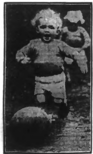
Le joueur de football anglais Yates est l'heureux vainqueur de deux jumeaux âgés de dix-huit mois.