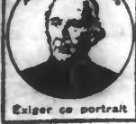
Exiger ce portrait

FEMMES qui SOUFFREZ, seriez-vous essayé tous les traitements sans résultat, que vous n'avez pas le droit de désespérer, et vous devez, sans plus tarder, faire une cure avec la JOUVENCE DE L'ABBÉ SOURY.