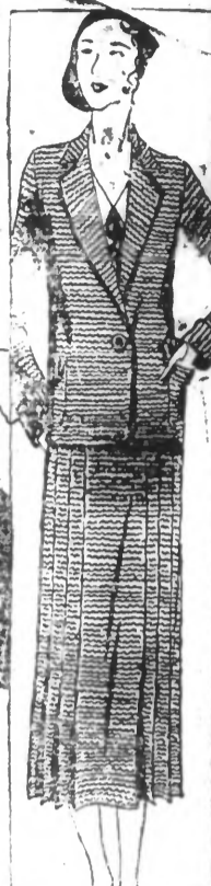
TAILLEUR en tulle fantaisie, belle qualité, couleurs mode. 150.