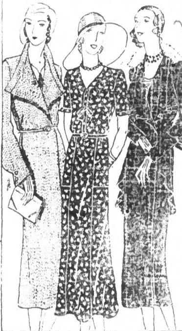
MANTEAU de ROBE en crêpe de MANTEAU en vier genre, drapé le long, orné de boutons, fantaisie, coloris à la mode, coupe et détails à la mode. Exceptionnel. Les Extraits en vel. mode. 150.