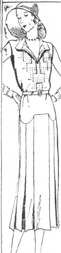
ROBE en toile gris fil, jours et bruderie main. Tons mode. 79.