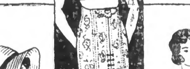
SOUTIEN-GORGE forme bonnet, en tulle brodé. Du 80 au 100. 13.00