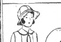
ROBE en piqué gar- nie croquet. Se fait en crinoline, garnie gros bleu, rose, nil, jaune, grain et fleurs. Se fait Du 0-48 au 29. 0-55 ..... 29. Le chapeau assorti. Entrées 55-54-56. Du 48 au 32. 15.00