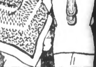
CARRÉ en crêpe de chêne naturel, coloris et dessins haute nouveauté et rabat. En faites veauté. Exception. blanc, rose, champagne. 18.50