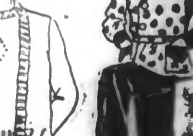
ENSEMBLE tricot FUYAMA veste armoire compasé du pull-over fantaisie, colote en tissu sans manches et gilet au bleu ou cerise. 36. manches longues, orné à ans ..... 36. motifs au poisson, de l'ait en rose, bleu, nil, de, 4 ans 3 ans 8 ans à ans 14 ans 54 ans 30 ans 30 ans 30 ans 29. 37. 35. 48. 52. 50. 37. 42. 45.