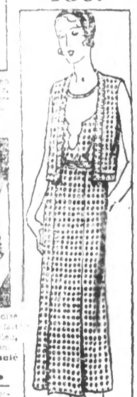
ENSEMBLE en crêpe de coton fantaisie, garni toile blanche, colons, natter, rose, vert, noir et blanc. 150.