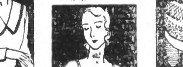
PARURE en crêpe de chêne artificiel, bord dentelle for- mant picot. Blanc, rose et champagne. Exception. 13.