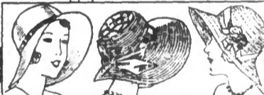
CAPELÈRE en crêpe de chêne naturel, garnie dentelle, noir, rose ou naturel. Entrées 53-55-57. 25.