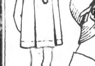
Petite CLOCHE compasé du pull-over fantaisie, colote en tissu sans manches et gilet au bleu ou cerise. 36. manches longues, orné à ans ..... 36. motifs au poisson, de l'ait en rose, bleu, nil, de, 4 ans 3 ans 8 ans à ans 14 ans 54 ans 30 ans 30 ans 30 ans 29. 37. 35. 48. 52. 50. 37. 42. 45.