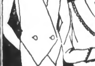
GILET pour tailleur, en piqué blanc seulement. 32.