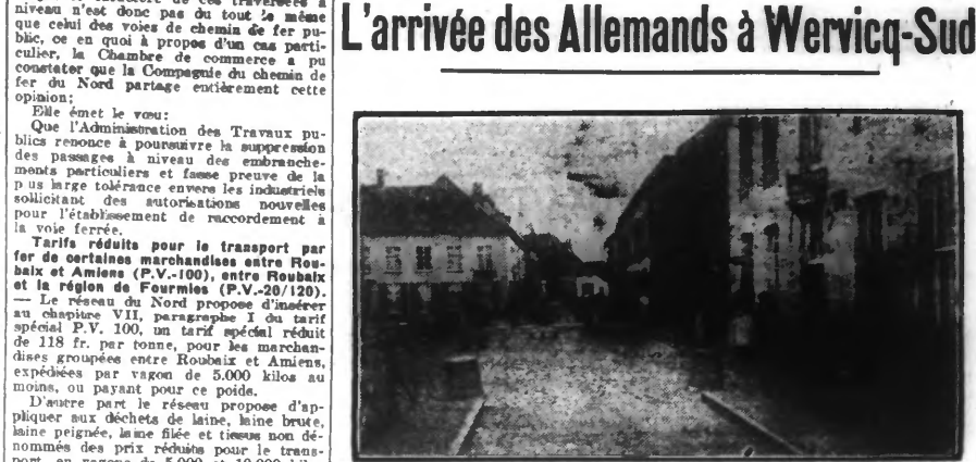
PHOTOGRAPHIE (1914), DU PONT FRONTIÈRE DE WERVICQ-FRANCE, PAR LEQUEL LES ALLEMANDS PÉNÉTRÈRENT EN FRANCE ET EN BELGIQUE LE 4 OCTOBRE 1914.

Dix-sept ans déjà! Les souvenirs s'en comptent dans le passé... Il en est pourtant qui sont encore présents à toutes les mémoires.