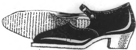
ARTICLE DE FATIGUE CHARLES X « SPORT », vachette box marron, semelles et talons « Wood-Milne », ou crêpe, ou cuir. Du 33 au 41. Ailleurs 49 fr. AU SOLDEUR... 29.95

Une force infailible à laquelle rien ne résiste : "LA CHAUSSURE FRANÇAISE" par ses prix incontestés, par son cachet spécial, par sa qualité irréprochable.