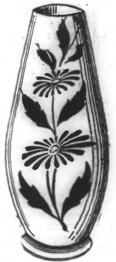
Pendant cette campagne publicitaire seulement, il sera offert UN SUPERBE VASE EN MAJOLIQUE de grande valeur, à tout acheteur

Tous nos articles sont garantis de premier choix et sans défauts. Toujours plusieurs millions de stock en magasin et arrivages tous les jours des toutes dernières créations.