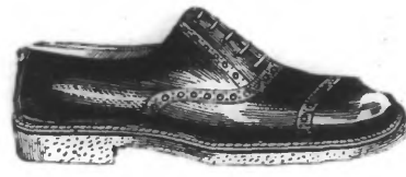
TRES RESISTANT BOX CALF acajou et noir, crêpe ou uskide, ou cuir, articles très résistants. Du 39 au 46. Ailleurs 69 fr. AU SOLDEUR... 39.95