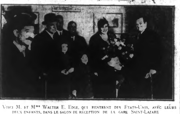
VOICI M. ET M ME WALTER E. EDGE, QUI RENTRENT DES ETATS-UNIS, AVEC LEURS DEUX ENFANTS, DANS LE SALON DE RECEPTION DE LA GARE SAINT-LAZARE