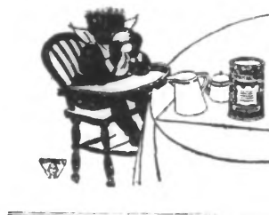
Feuilleton du 'Journal de Roubaix' du 22 décembre 1931