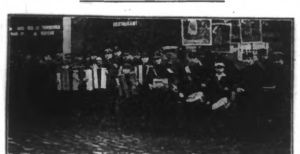
LA SOCIÉTÉ DES ACCORDÉONISTES ROUBAÏSIENS