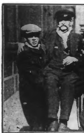
Un infirme va accomplir son devoir électoral au bureau de la place Notre-Dame, à Roubaix