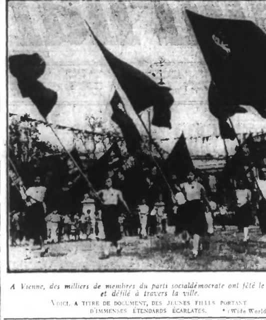
A Vienne, des milliers de membres du parti social-démocrate ont fêté le 1 er mai et défilé à travers la ville.