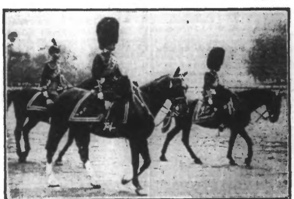
On sait que l'Angleterre a célébré l'anniversaire du roi George V qui vient d'avoir soixante-sept ans. Voici, pendant le défilé des troupes (de gauche à droite): LE DUC D'YORK, LE PRINCE DE GALLES ET LE ROI GEORGE V.