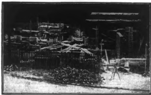
LES TRAVAUX EN COURS CÔTÉ DE LA RUE BARBIEUX

Depuis quelques jours, le projet d'agrandissement du Collège de jeunes filles à Roubaix est entré dans une phase pratique et les chantiers sont ouverts rue de Barbieux et boulevard de Douai.