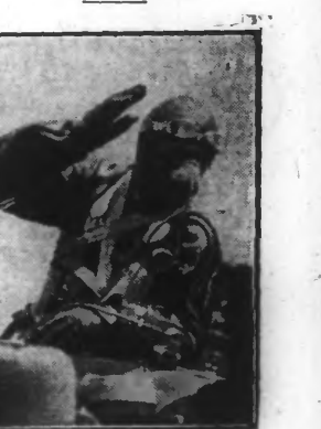
On sait que le jeune aviateur parachutiste français, René Machenaud, a réussi un saut de 7.500 mètres, battant ainsi le record du monde de saut en parachute, détenu par l'aviateur belge Willaebroe, dit « le petit coppen ».