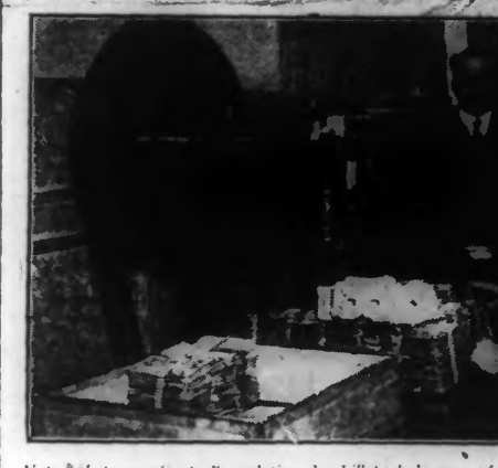
Notre photo représente l'annulation des billets de banque périmés, à l'aide d'une machine spéciale, à la Banque nationale de Belgique, à Bruxelles.