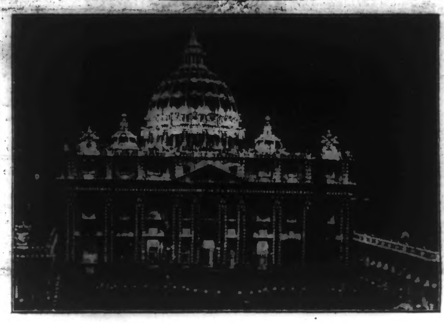
LA BASILIQUE DE SAINT-PIERRE DE ROME MAGNIFIQUEMENT ILLUMINÉE À L'OCCASION DE LA PENTECÔTE.