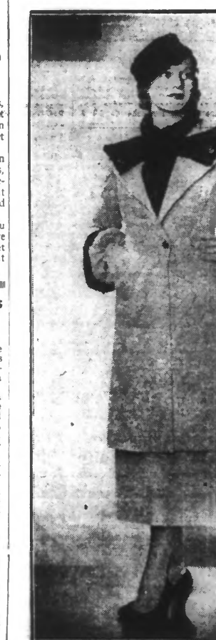
Ensemble d'après-midi en lainage angora beige, garni de breitchwanz noir. Le chapeau et l'intérieur des gants sont en même fourrure. Lorsqu'on retourne les gants, ils forment manchon. Le manteau trois-quarts est en même linage que la robe. (Création Heim.) (N.Y.T.)