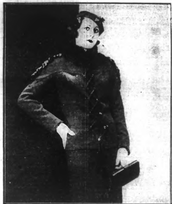
Petit tailleur en lainage ilota garni de loutre dorée. Un laçage nouveau ferme la jaquette. (Création Ardanc.) (N.Y.T.)

N'employez donc jamais l'eau bouillante, même pour faire votre vaisselle. Une petite cuillerée de Sel JAKO dans une bassine d'eau simplement tiède dégraissera merveilleusement vos assiettes, plats et couverts, et supprimera toute odeur désagréable, tout en constituant pour vos mains un vrai bain adoucissant.