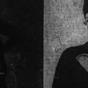
Robe du soir en faille noisette. (Création Magg Rouff.)