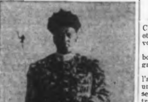
LE MAHARADJAH D'ALWA est arrivé à Rome, d'où il compte repartir prochainement pour Paris.