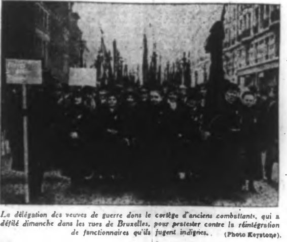
La délégation des veuves de guerre dans le cortège d'anciens combattants, qui a défilé dimanche dans les rues de Bruxelles, pour protester contre la réintégration de fonctionnaires qu'ils jugent indignes.