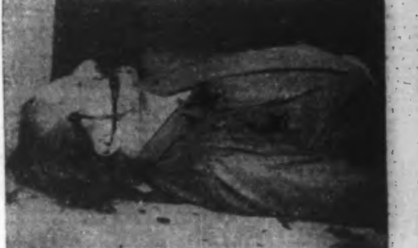
CE BÉLINGRAMME REPRÉSENTE STAVISKY APRÈS SA TENTATIVE DE SUICIDE