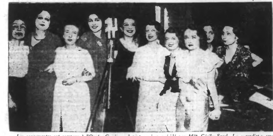
Les concurrentes ont comparu à l'Opéra-Comique, devant un jury présidé par M lle Cécile Sorel. Le verdict sera rendu le 12 mai.