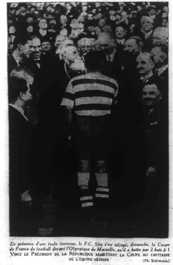
En présence d'une foule immense, le F.C. Sète s'est adjugé, dimanche, la Coupe de France de football devant l'Olympique de Marseille, qui a battu par 2 buts à 1...