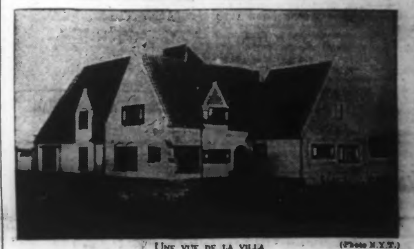
Cette villa dont les aménagements avaient été commencés alors que le Roi et la Reine des Belges étaient encore prince et princesse, est prête à recevoir ses hôtes...