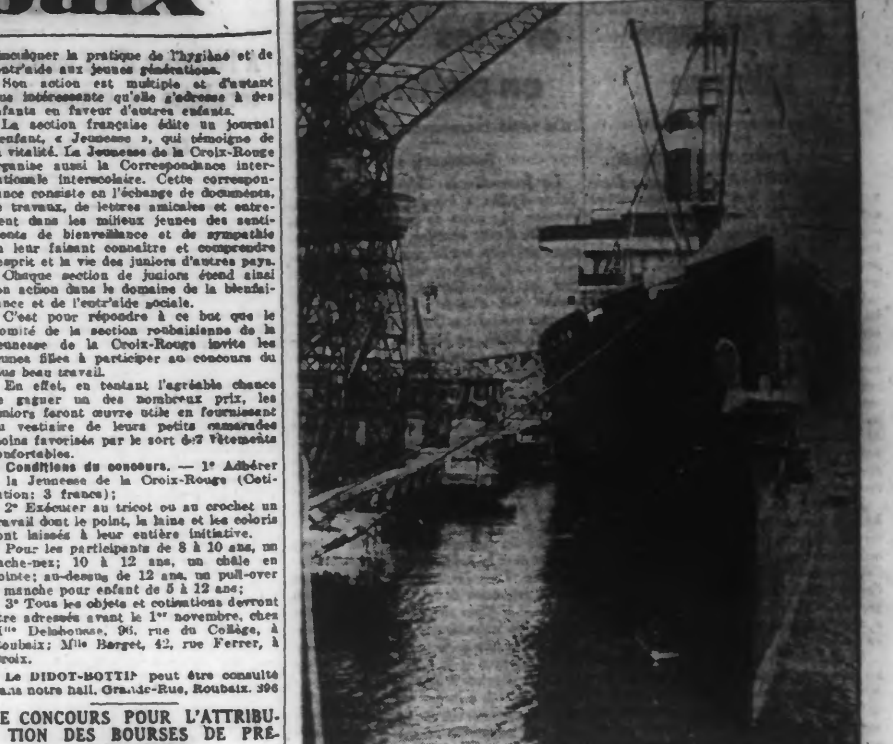
Le Havre a accueilli le paquebot géant LEVIATHAN (49.000 tonnes), de la Compagnie United States Lines, qui arrive de New-York. C'est la première visite de ce sont déroulés, en présence des membres des Cercles gouvernementaux et municipaux superbes transatlantique à notre port maritime. A cette occasion, des réceptions ont été données.