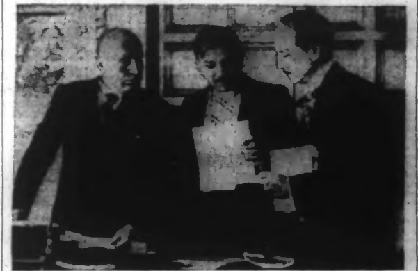
Voici, de gauche à droite: M. MUSSOLINI, chef du Gouvernement italien; M. PIERRE LAVAL, ministre français des Affaires étrangères, et M. ALEXIS LÉGER, secrétaire général aux Affaires étrangères en France.