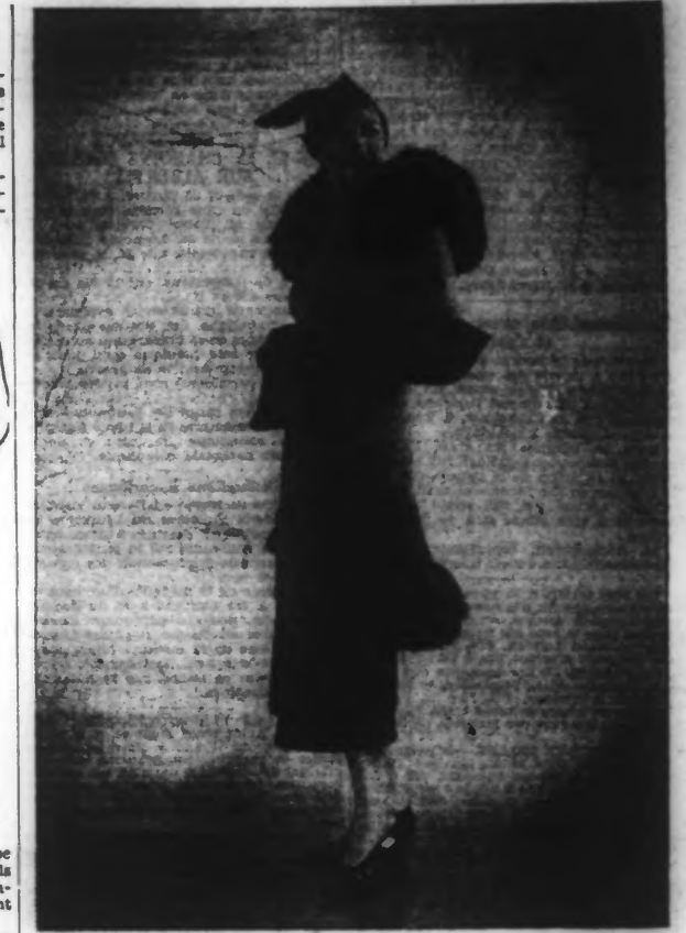
Tourbillon, jaquette en lainage vert garnie de renard noir, jupe de lainage noir. (Création Paquin.) Chapeau de M me Suzy.

Trois-quarts ou longs manteaux prennent volontiers, cette saison, l'allure classique : corsage ajusté, taille pincée, par-dessus.