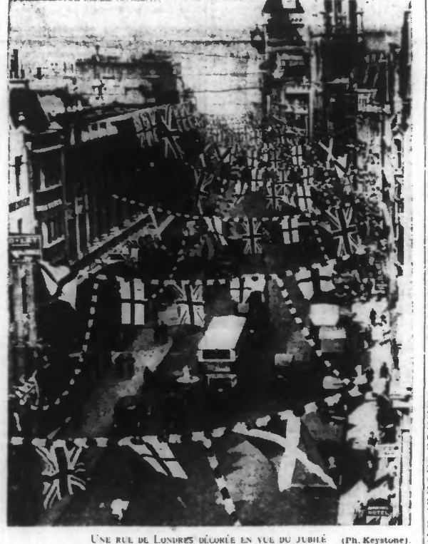
UNE RUE DE LONDRES DÉCORÉE EN VUE DU JUBILÉ.

Paris, 4 mai. — En raison des élections municipales et selon la décision prise en 1933 dans des circonstances analogues, le Gouvernement a décidé de reporter du 12 au 19 mai la célébration de la fête nationale de Jeanne d'Arc.