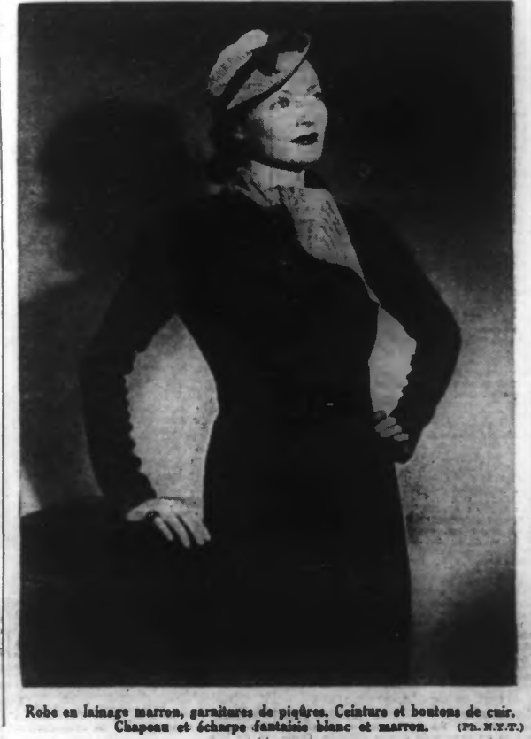
Robe en lainage marron, garnitures de piqué. Ceinture et boutons de cuir. Chapeau et écharpe fantaisie blanc et marron.

Rognon de veau à la persillade Éplucher et parer un beau rognon, que l'on fera frire dans sa graisse avec une bonne poignée d'échalotes hachées, un demi-verre de bon vin blanc et un bouquet garni. Saler, poivrer et lier avec une cuillerée de farine. Faire cuire une demi-heure à feu vif. Servir sur un plat chauffé avec une persillade à base d'échalotes. Potage Solférino Préparer une purée de tomates que l'on mouille avec du bon bouillon. Couper en petits dés des carottes et des navets que l'on cuira au beurre et que l'on ajoute ensuite à la purée de tomates. Semer dans le potage du cerfeuil haché. Assaisonner fortement de poivre de Cayenne et servir très chaud.