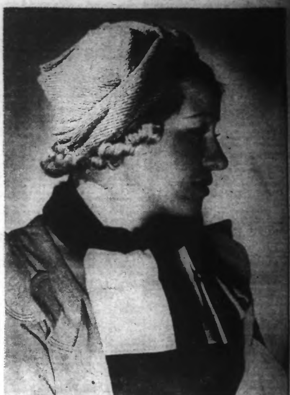
Pour l'été, une jolie toque en paille jaune garnie d'une boucle marron.