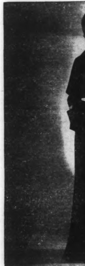
Robe de soir en marocain marine. Boutons marine. Col garniture de piqué blanc fantaisie. Petit manteau en feutre rouge.