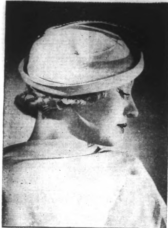
Toquet à bord relevé en «lastex» bleu, garni d'une plume fantaisie pastel blanc et noir.