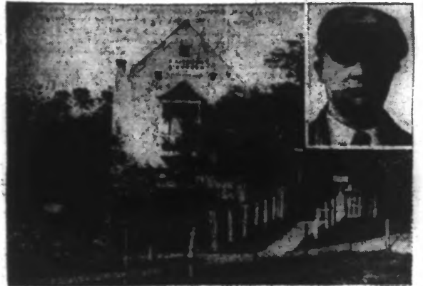
LA MAISON OÙ S'EST DÉROULÉ LE DRAME