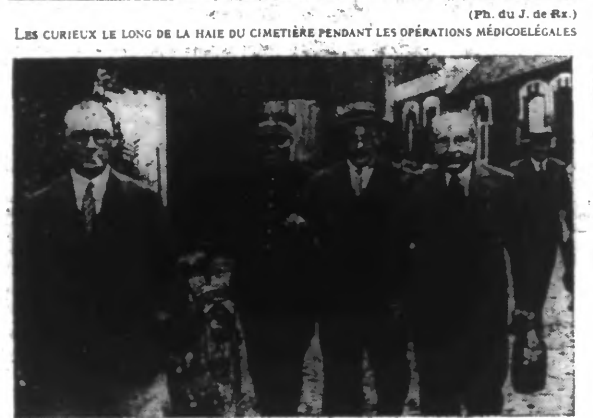
LES CURIEUX LE LONG DE LA HAIE DU CIMETIÈRE PENDANT LES OPÉRATIONS MÉDICO-LÉGALES