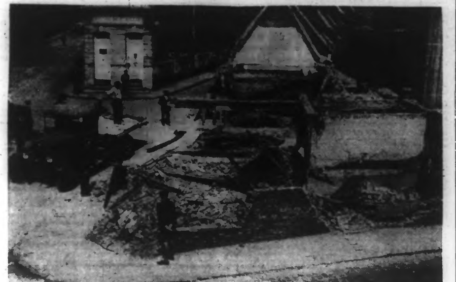
Ce qui restait mardi soir du cabaret de la "Planche Trouée"

LE PLUS VIEUX CABARET DE ROUBAIX EST MORT