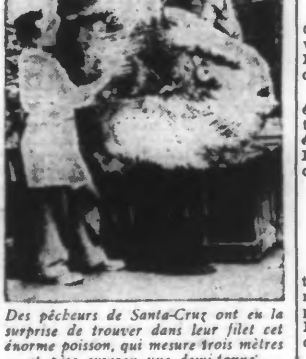
Des pêcheurs de Santa-Cruz ont eu la surprise de trouver dans leur filet cet énorme poisson, qui mesure trois mètres et pèse environ une demi-tonne.