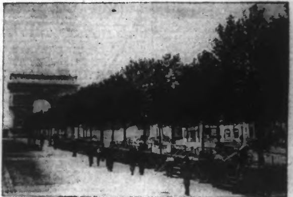
LES PRÉPARATIFS POUR LES FÊTES DU 14 JUILLET: AUX CHAMPS-ÉLYSÉES ON MONTE LES ESTRADES.

Paris, 11 juillet. — Samedi soir commença dans Paris l'arrivée des délégués du Front commun venus des départements. Une conférence a réuni, au Quai d'Orsay, dans le cabinet de M. Laval, M. Paganon, M. Fabry, le préfet de police et un certain nombre de personnalités chargées d'assurer l'ordre.