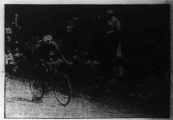
LE PASSAGE DE VIETTO AU COL DE LA TAMIE

Un avion est en place pour les essais. A gauche: Les filtres à air. Les énormes ventilateurs de cette soufflerie créent autour de l'avion un courant d'air de 180 kilomètres à l'heure (soixante mètres à la seconde) pour lui faire subir l'expérience de résistance.