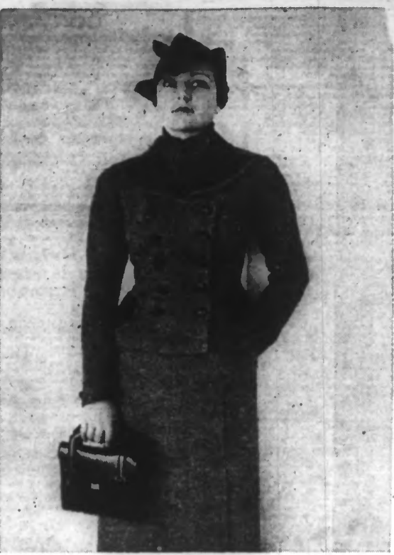
Costume de sport en tweed chiné bordeaux et bleu, poches et parements de cuir bleu; écharpe écossaise. (N.Y.T.)

PERSÉPHONE la gaine de qualité NE FAIT PAS DE VENTRE Gaine 7529 corail 140 Fr. des lacés, côté agrafé. SOUTIEN-GORSE POINTU CIMBONNET 7248 avec bande Prix: 40 Fr. EN EXCLUSIVITÉ: M me DESESPRINGALLE 23, Boulevard Carnot, LILLE Merveilles à la confection Travailler ensemble: 500 grammes de sucre farine de froment, 100 grammes de beurre fin, du sucre, du sucre de citron, un soupçon de sel. Lorsque la pâte est bien homogène, faire un trou au milieu, y passer trois œufs et travailler de nouveau. Laisser reposer pendant une petite heure, séparer la pâte par petites parties de l'importance d'un œuf de péage; aplatis la pâte jusqu'à en former un disque mince; tourner chacun en cercle, jeter en pluie friture; égoutter, dresser et verser au centre une cuillerée de confiture d'orange.