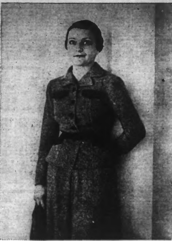
Un ensemble en tweed gris, pour le sport et la chasse; veste et jupe-culotte, garniture en cuir marron et écharpe écossaise. (N.Y.T.)