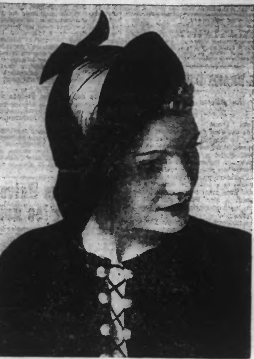
Chapeau antilope noir relevé devant. La calotte découpée laisse voir les cheveux.