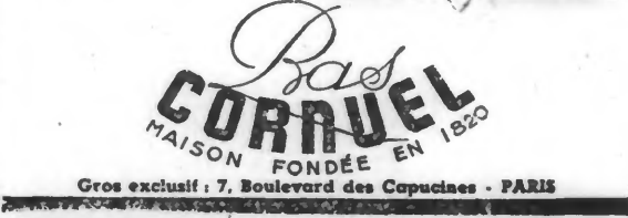
Gros exclusif: 7, Boulevard des Capucines - PARIS

Quand vous mettez une paire de bas, vous n'avez pas toujours pris la précaution d'examiner par transparence l'aspect de ces "ombres" ou des "cercles". Ceux, au contraire, qui admireront vos jolies jambes gainées de soie seront délavablement impressionnés par ces défauts de fabrication qui rompent l'harmonie d'une ligne. Pour les spécialistes des bas avec "ombres" et "cercles" sont en quelque sorte "tachés". Vous voudrez donc vous assurer des bas impeccables en ne portant que des BAS CORNUEL de pure soie naturelle, clairs, limpides et moles, dont le usage spécial CORNUEL exclut absolument les "ombres" et les "cercles" et qui sont teints par le procédé G.S.S. qui conserve à la soie toute sa solidité.