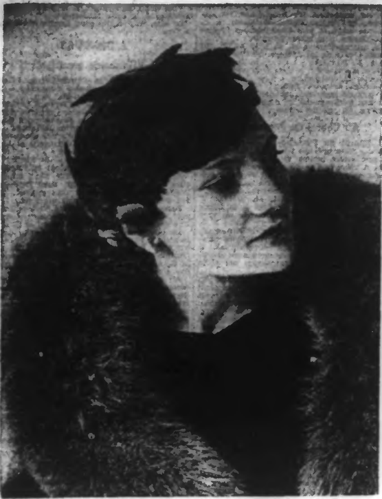
Petite toque de plumes marron.

LANGENHEIM (415 m. 8, 100 kw.). — 12 h.: Poste. — 13 h.: 15: L'été et pièces instrumentales. — 14 h.: 15: Concert. — 15 h.: 15: Soirée gala. — 20 h.: Concert. — 21 h.: 15: Concert. — 22 h.: 15: Concert. — 23 h.: 15: Concert.