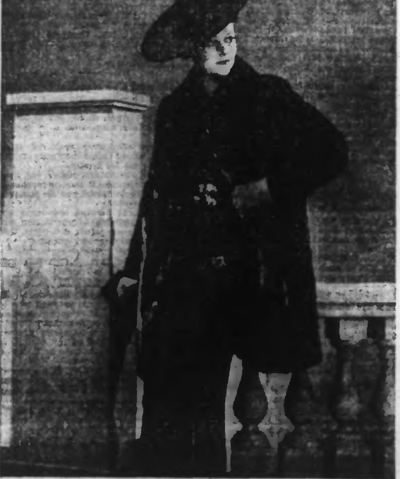
Manteau trois-quarts en loutre.