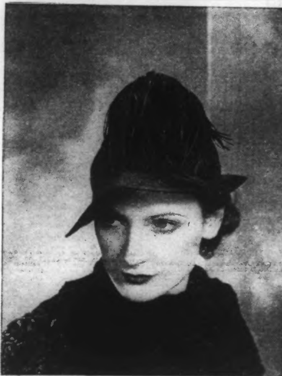
Chapeau de feutre garni de plumes rouges