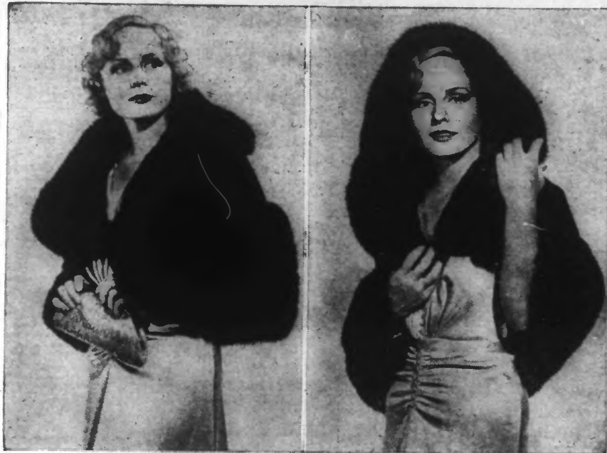
Court manteau de velours brun, garni de zibeline, porté par Madge Evans, pour une soirée dansante. Le capuchon ramené sur la tête protège la chevelure.

3° — Ensemble en beau lainage noir dont le haut du manteau, c'est-à-dire les manches, empiècement et col, est en agneau rasé noir.