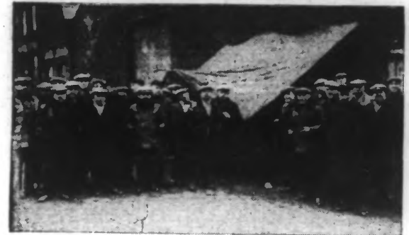
LES GRÉVISTES MONTENT LA GARDE DEVANT LE DÉPÔT DES TRAMWAYS DE LA RUE DE MASCARA, A ROUBAIX.

La journée de jeudi n'a apporté aucun changement dans le pénible conflit qui, depuis bientôt quinze jours, prive notre région du plus pratique des moyens de locomotion, le tramway.