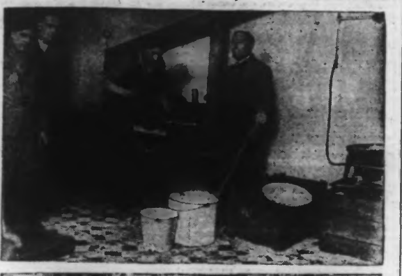
En haut: LA CUISINE. — En bas: LE RÉFECTOIRE.

Le mouvement social français des Croix de feu vient de rouvrir sa "soupe" au 39, rue de la Fosse-aux-Chênes. Déjà près de 1.000 repas ont été distribués dans des locaux spécialement aménagés.