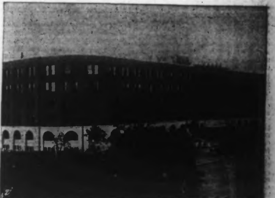
LE NOUVEAU MINISTÈRE DE L'INTÉRIEUR, OU M. GOTO A ÉCHAPPÉ AUX BALLES DES ÉMEUTIERS.

Dix-huit de leurs officiers se sont tués par ordre. L'amiral Okada, que l'on croyait mort, avait pu se cacher !