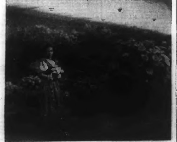
A Nice se tient actuellement une exposition, où les fleurs de la Côte d'Azur mêlent leurs couleurs dans un ensemble merveilleux.