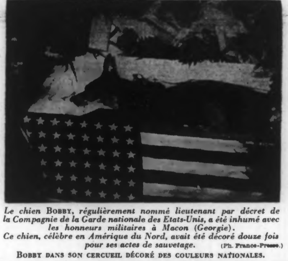
Le chien BOBBY, régulièrement nommé lieutenant par décret de la Compagnie de la Garde nationale des Etats-Unis, a été inhumé avec les honneurs militaires à Macon (Georgie). Ce chien, célèbre en Amérique du Nord, avait été décoré douze fois pour ses actes de sauvetage.