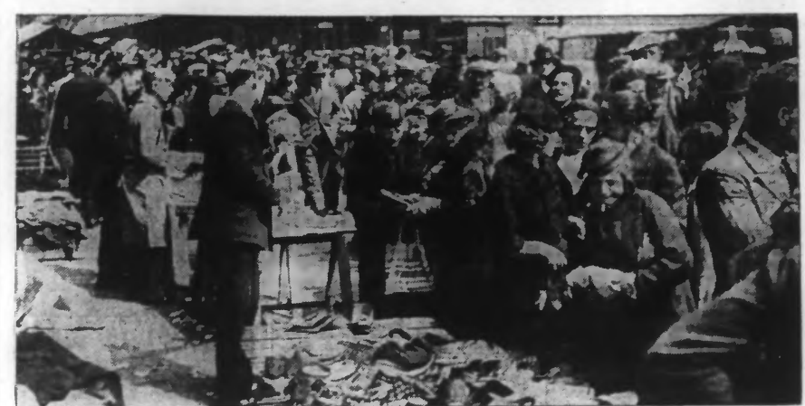
LA FOULE DEVANT LES ÉVENTAIRES.

Le lundi de la Pentecôte ramène invinciblement la braderie de la rue de l'Ommelet. Une fois de plus, donc, les « bradeux » vinrent s'installer, fidèles au rendez-vous et, en un clin d'œil, ils transformèrent les trottoirs en d'interminables échoppes, et la rue en un immense bazar tout bruisant de mille bruits. La foule des visiteurs débambula au milieu de deux haies de « bradeux », faisant parfois devant un éventaire prometteur d'occasions un petit liot de curieux, que l'on ne foudroyait que difficilement, avec de larges remous dans la foule. Malheureusement, la pluie vint gêner la fête, et les visiteurs s'en furent, rapidement, et que les « bradeux » se retourneraient.