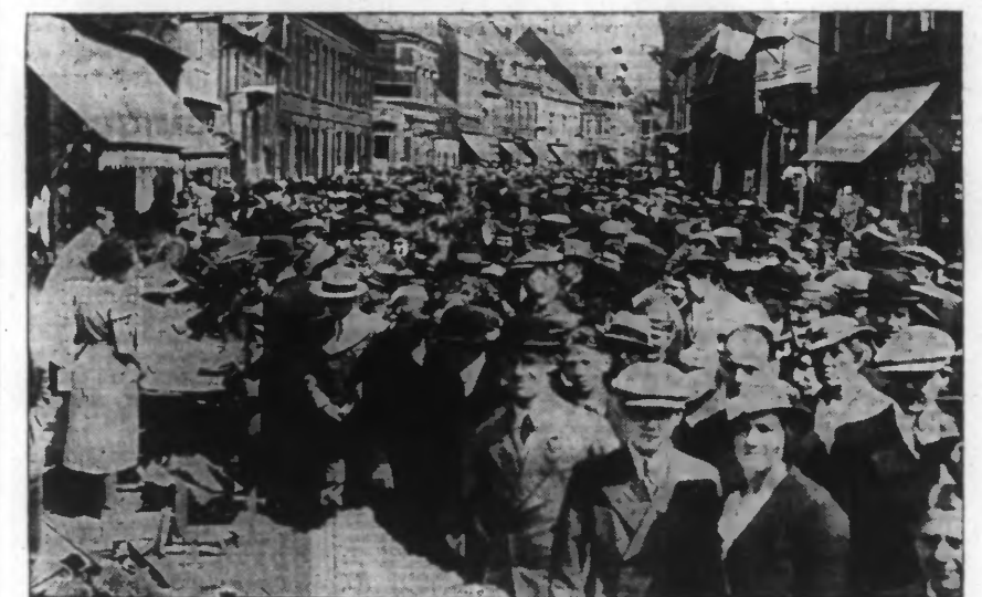
UNE VUE DE LA FOULE A LA BRADERIE DE LA RUE DE GAND.

La journée de lundi C'est sous les rayons d'un soleil un peu plus généreux que s'est déroulée la seconde journée des fêtes officielles des rues de Gand et des Phalempins et une nombreuse affluence a suivi avec un vif intérêt toutes les manifestations qu'un comité remarquablement actif avait prévues pour la fête et la gaieté de la population.