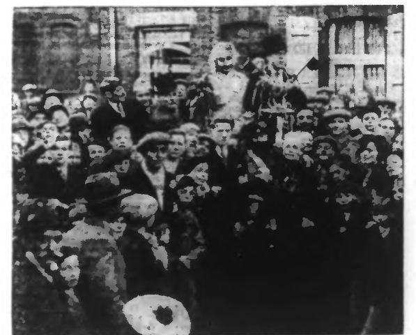
LES HABITANTS DU QUARTIER CONDUISENT LE NOUVEAU MAIRE A LA MAISON COMMUNE.

Les habitants de la commune libre de la rue de Béthune, à Roubaix, ont continué à fêter, lundi, leur autonomie d'un moment, et toute la journée la petite république d'opérette connut la plus joyeuse animation.