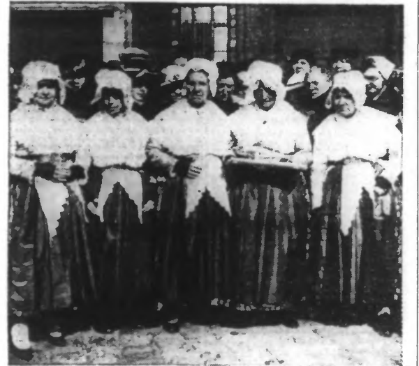
La traditionnelle fête du poisson d'argent a revêtu cette année, à Dunkerque, un éclat tout particulier. LES « BAZINNES » OU FEMMES DE PÊCHEURS, AVANT LA REMISE SOLENNELLE À LA VIERGE DU SYMBOLOGIQUE POISSON.