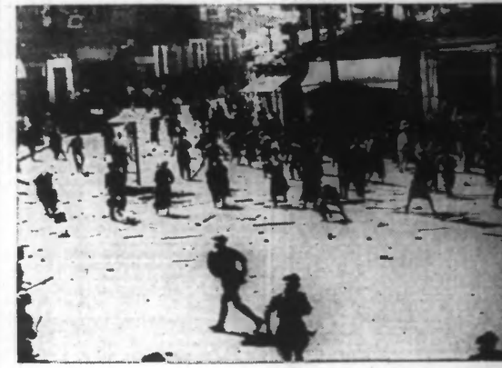
UNE SCÈNE D'ÉMUTE: LES ARABES, ARMÉS DE PIERRES ET DE BATONS, SE JETTENT SUR LES SOLDATS ET LA POLICE.