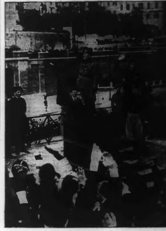
LES CHEFS DES MILICES QU'IL SALUE.