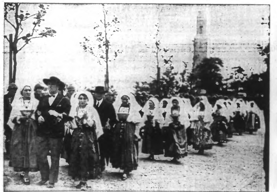
Le séjour du président Lebrun, à Brest, s'est terminé par un défilé breton dont voici une délégation.