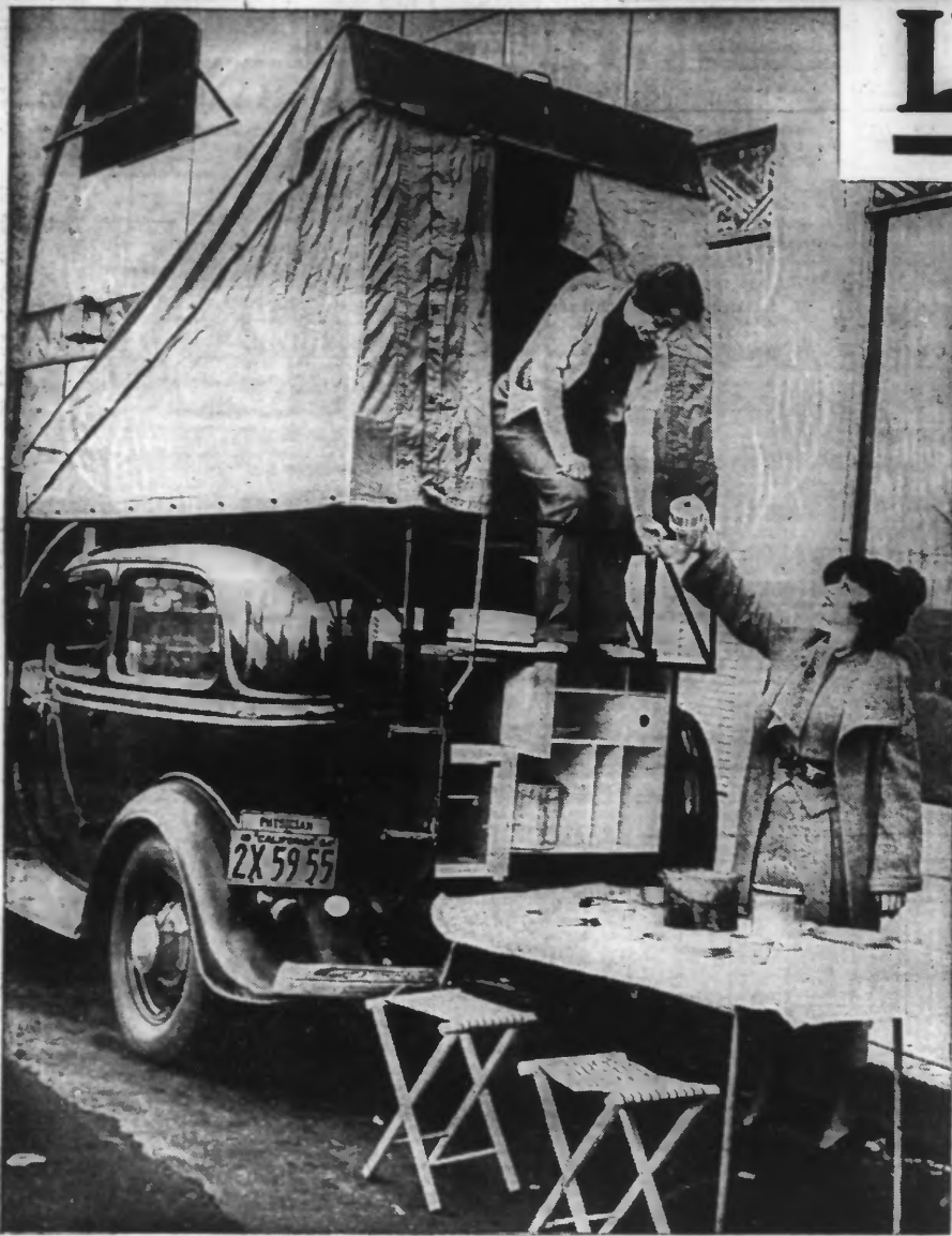
La nouvelle auto-camping que les Américains utilisent pour leur week-end et qui est, paraît-il, très pratique.