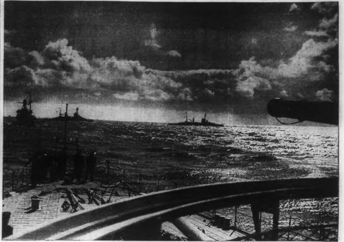
M. Lebrun, après avoir inauguré à Brest la nouvelle Ecole navale, y a assisté à des exercices qui se sont déroulés au large de Brest.