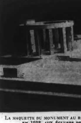
LA MAQUETTE DU MONUMENT AU ROI ALBERT I er QUI SERA INAUGURÉ EN 1938, AUX ÉCLUSES DE NIEUPORT, SUR L'YSER.