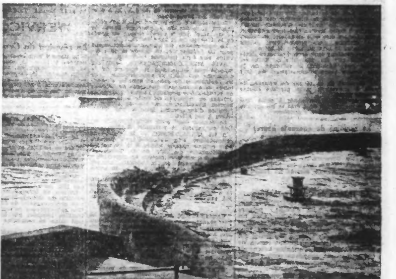
LA TEMPÊTE SUR LES CÔTES ANGLAISES D'énormes vagues viennent se fracasser contre la digue de Scarborough.