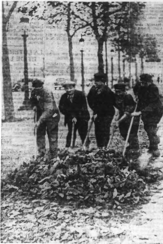
LES FEUILLES TOMBENT Aux Champs-Élysées, des ouvriers débarrassent l'avenue de l'épais tapis de feuilles qui recouvre les allées.