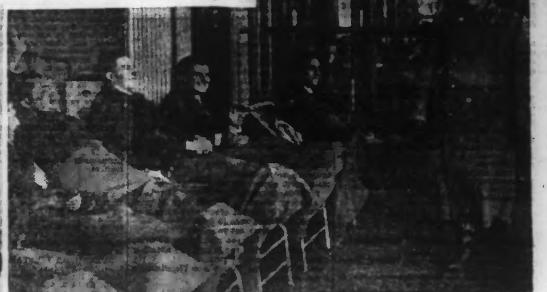
M. Mussolini a inauguré le nouveau sanatorium de Montecatone, dans la région de Bologne.