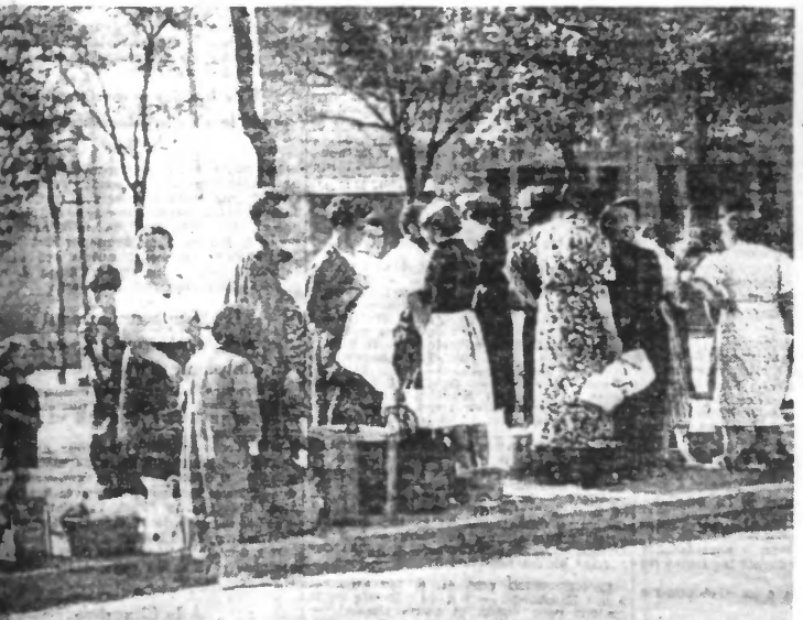
L'eau ne se gaspille pas à Madrid. Les habitants se groupent aux points d'arrêt des camions qu'ils approvisionnent.