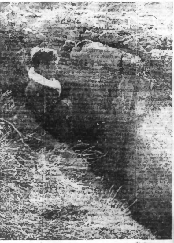
L'ENCERCLEMENT DE MADRID Une sentinelle républicaine monte la garde dans une tranchée.