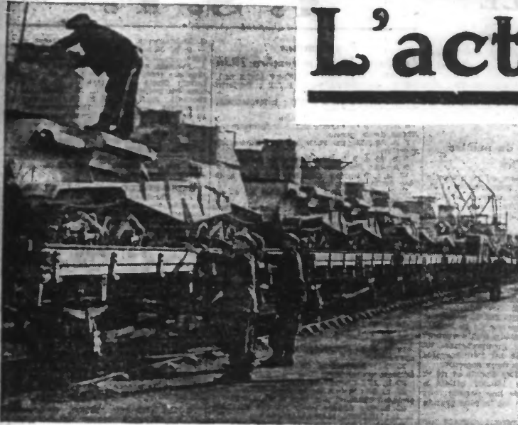
Le calme semble revenir en Palestine; de nombreuses troupes envoyées en renfort ont été rappelées en Angleterre. — Des chars d'assaut, revenant de Palestine, sont acheminés par fer à Southampton.