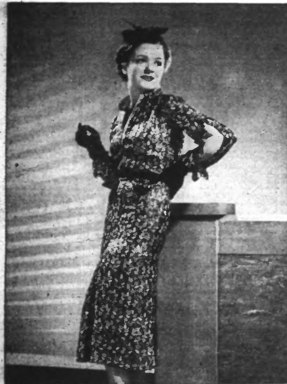
Élégante robe en lamé or.