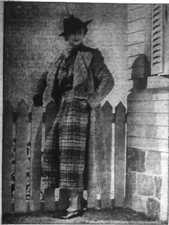
Manteau de tweed gris-vert et jupe-calotte pour la bicyclette.