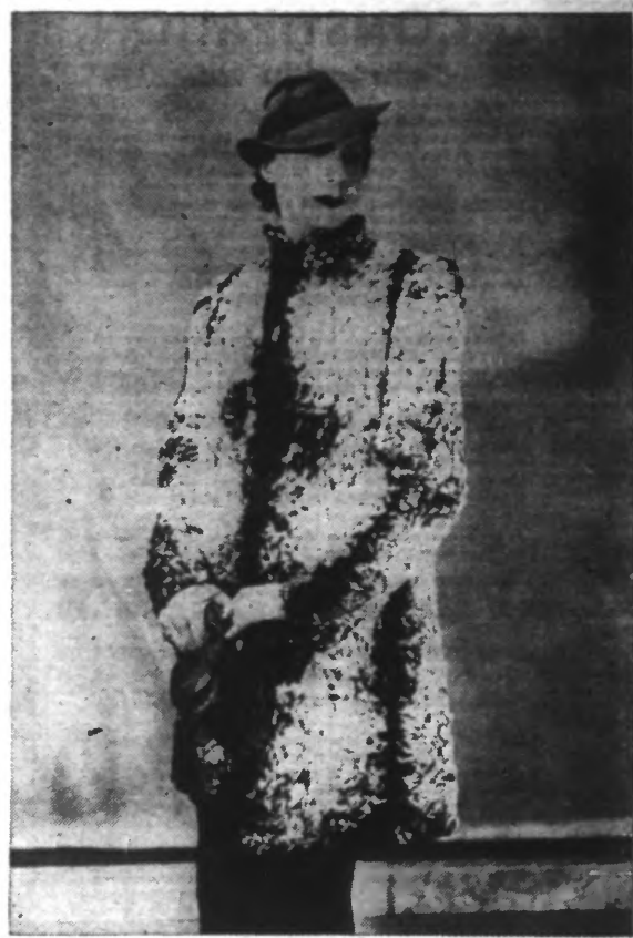
Manteau d'agneau des Indes naturel, blanc et noir.

32, rue du Fosse-aux-Loups, Bruxelles, et à Courtrai, Gand, Tournai, Mons, Namur, Péruwelz. 24113