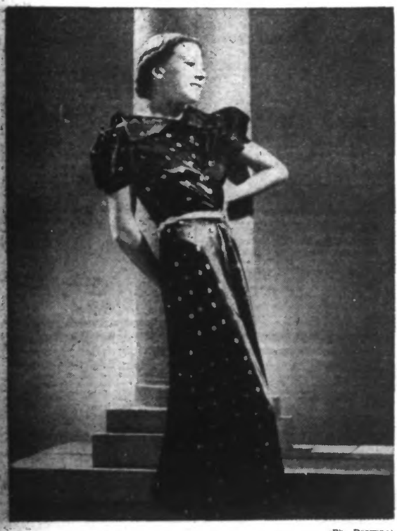
Robe habillée en taffetas noir et or.