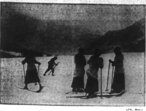
...ET EN 1936