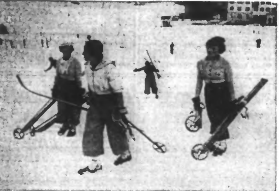
Les jeunes pensent volontiers qu'avant eux rien n'était bien... On souscritait à leurs prétentions au contraire des robes qui jogaient les Françaises il y a vingt-six ans — jusque dans la pratique du sport! — et de tenues, si pratiques, de leurs filles de 1936.