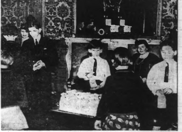
Suivant la coutume, le jeune roi Pierre de Yougoslavie et ses frères ont distribué des cadeaux de Noël aux enfants pauvres de Belgrade.