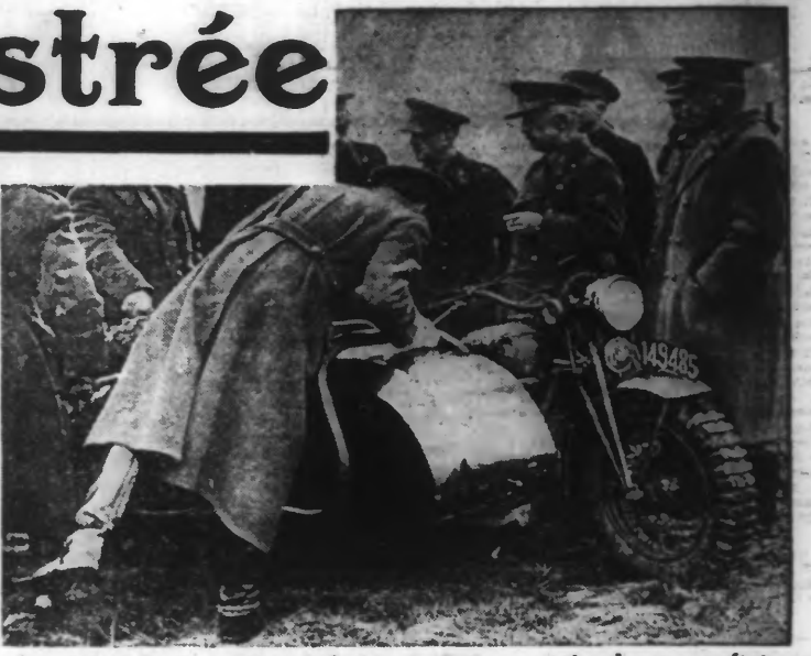
Le général Denis, ministre belge de la Défense nationale et son état-major inspectent un side-car qui vient de participer aux manœuvres de liaison « tous terrains » d'unités motorisées et d'infanterie, qui ont eu lieu sur la route de Namur.