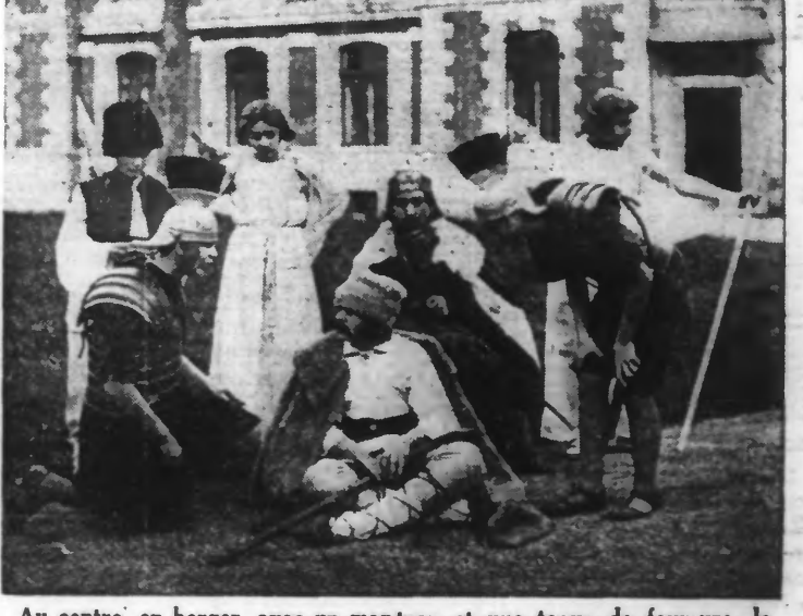
Au centre, en berger, avec un manteau et une toque de fourrure, le voivode Michel, prince héritier de Roumanie, entouré de ses camarades d'études, avec lesquels il vient de donner à Bucarest une représentation pour les fêtes de Noël.