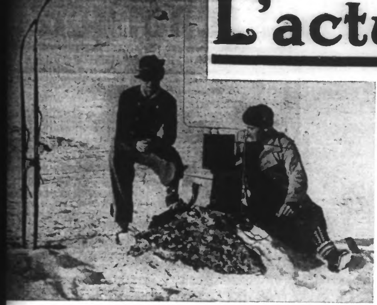
LA T.S.F. AU SERVICE DES SPORTS D'HIVER Un des postes émetteurs et récepteurs placés à l'arrivée et au départ des courses de ski, pour le chronométrage exact de celles-ci.