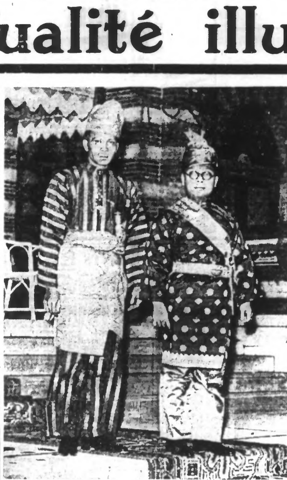
Le mariage de la princesse Juliana amène à La Haye des hôtes de marque venus des Indes néerlandaises. — Voici les représentants du sultan de Lankat (Sumatra) arrivant à l'hôtel: A gauche, T. Mansuerjah, prince héritier de Kolopah et, à droite, le frère du sultan.