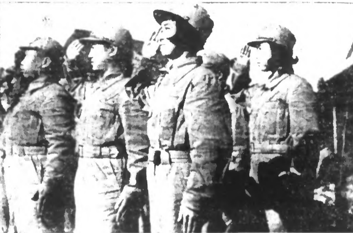
Au camp de Matsudo, près de Tokio, un groupe de jeunes planeuses, de l'école de vol à voile que le Gouvernement japonais a créée spécialement pour y recevoir 10.000 élèves.