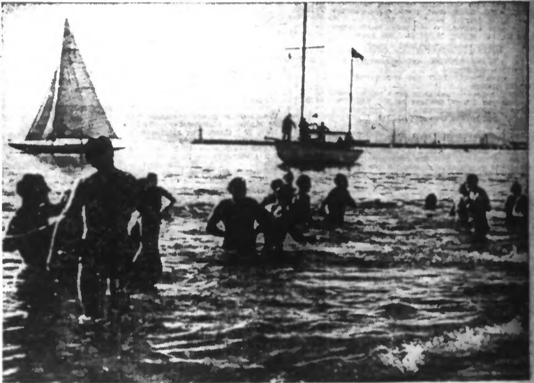
Le bain du Nouvel An 1937, organisé par la Municipalité de Cannes pour les hivernants qui désirent recevoir à cette occasion les récompenses offertes par le Conseil municipal.