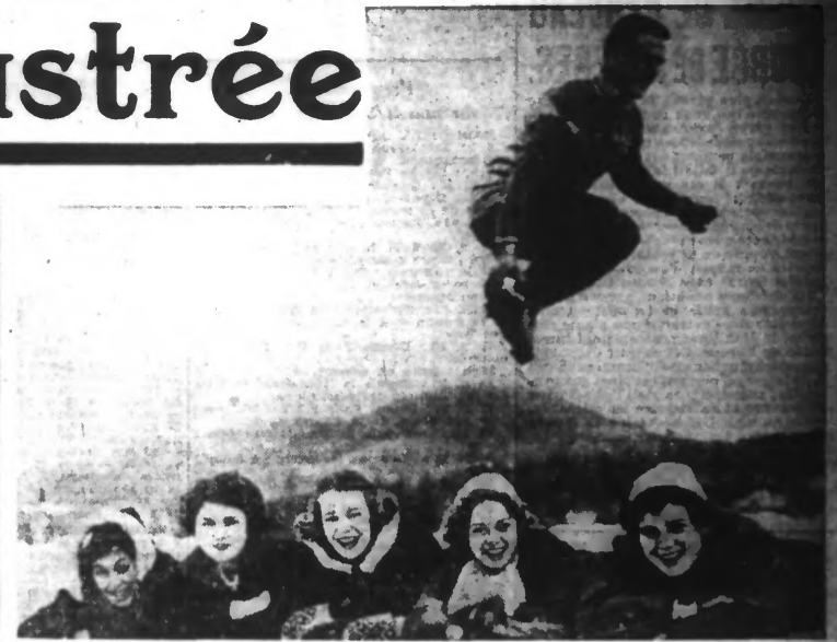
Bunnle Sheffield, champion du saut en longueur, saute par-dessus cinq ferventes des sports d'hiver, à la station du lac Placid (New-York).