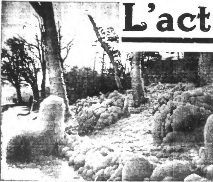
Sous la bise, les gais rivages du lac de Genève prennent cet aspect sauvage et les rochers, humides, couverts de gel, deviennent autant de blocs de glace.