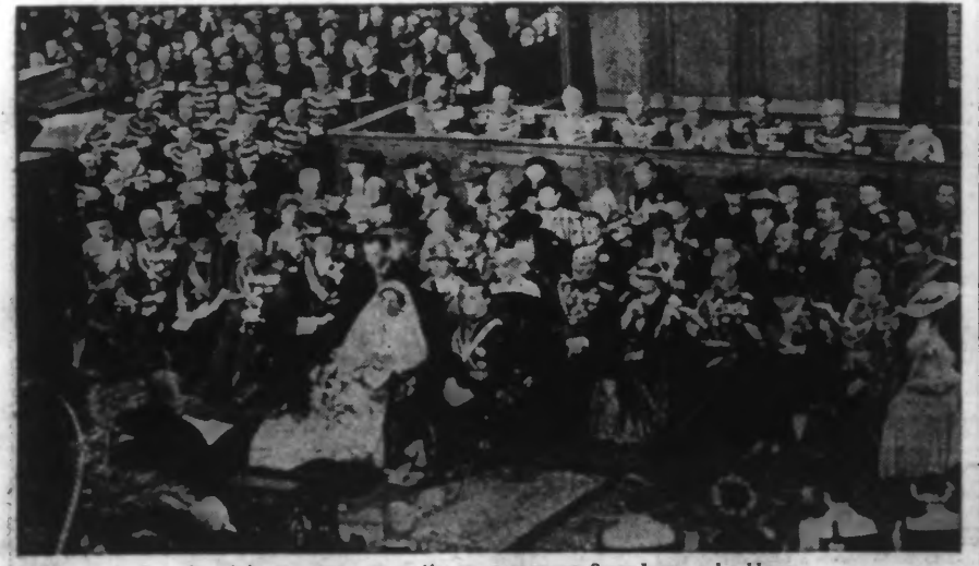
LA CÉRÉMONIE RELIGIEUSE A L'ÉGLISE PROTESTANTE SAINT-JACQUES, A LA HAYE. La PRINCESSE JULIANA et le PRINCE DE LIPPE sont devant tous les membres de leurs familles, tandis que le pasteur (à gauche, vu de dos) officie.