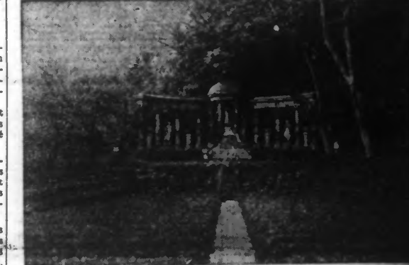
LA ROSERAIE DE L'HAY-LES-ROSES (P. N.Y.T.) une des plus belles d'Europe, que le département de la Seine va acquérir pour environ six millions de francs.