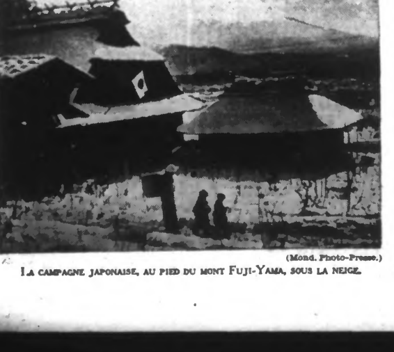
LA CAMPAGNE JAPONAISE, AU PIED DU MONT FUJI-YAMA, SOUS LA NEIGE