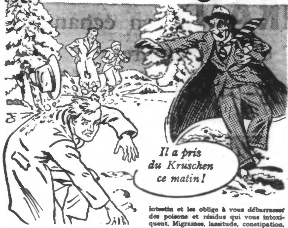
Il a pris du Kruschen ce matin!

PANI! Attrape celle-là!... Grand-Papa est déchaîné: un enfant ne s'amuse pas plus que lui! Mais n'est-ce pas un "grand enfant"?