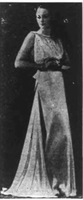
Grande robe du soir, aux lignes évadées dans le bas, en faille blanche, décolletée dans le dos.