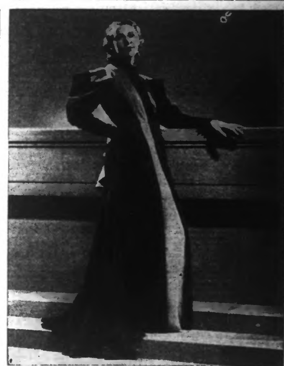
Manteau du soir en velours mat, marron et rouge corail, avec fourrure de martre.

Dents blanches et gencives saines sont assurées par la Poudre et le Pâte DENTIFRICE VICHY-ETAT, à base de Vichy-Etat, particulièrement recommandées aux arthritiques pour combattre la carie des dents. En vente partout. 3164