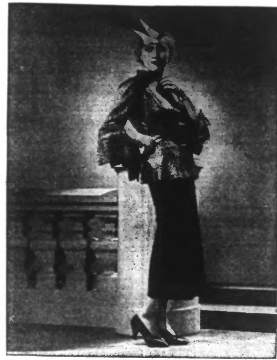
Ensemble d'après-midi: la jaquette, en lamé or et bleu, sur jupe en velours bleu. Chapeau feutre bleu, avec plumes bleues et blanches.

Les stations émettrices belges versant aux compositeurs ou à leurs mandataires des redevances ont d'ailleurs, il est prouvé, capté au moyen d'un appareil de T.S.F. un concert musical public et de le diffuser à son tour au sein d'un grand nombre de postes de T.S.F. sans que les droits des auteurs, lesquels, pour cette raison, ne peuvent exiger le paiement de redevances simultanément des postes émetteurs et des détenteurs des postes récepteurs.