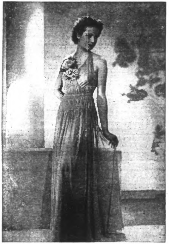
Robe du soir en mousseline de soie verte, agrémentée d'un effet de fronces et ornée d'un bouquet de roses au corsage.