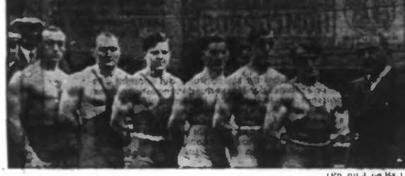
UNE BELLE BROCHETTE D'AS ROUBAISAIENS