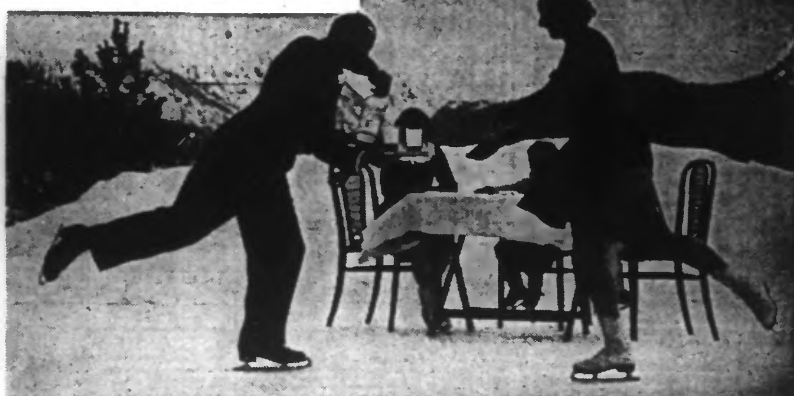
Garçon ! un peu de glace s'il vous plaît.