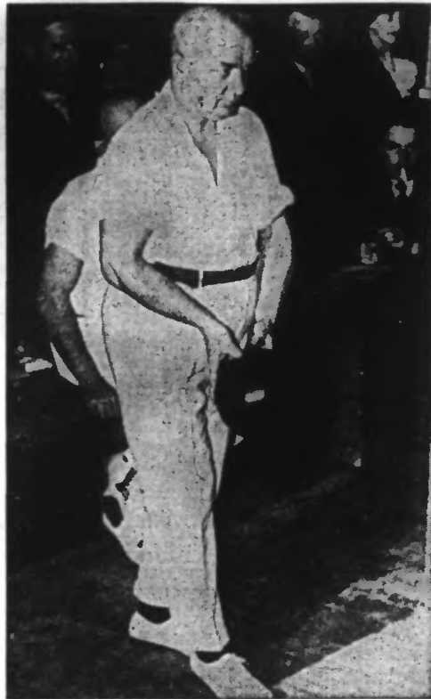
M. Albin Hansson, président du Conseil suédois, est un fervent du jeu de boules et il fait partie du cercle bouliste de Stockholm.