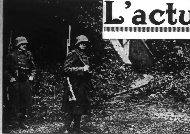
Des soldats hongrois gardent les abords de la mine de Pecs, où 265 mineurs s'étaient enfermés, faisant la grève de la faim.