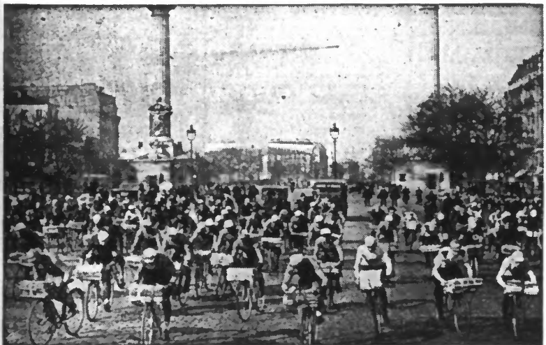
Le départ du Critérium des porteurs de journaux, la populaire épreuve qui s'est disputée pour la douzième fois, sur le tour de Paris, avec comme point de départ et d'arrivée, le Cours de Vincennes.