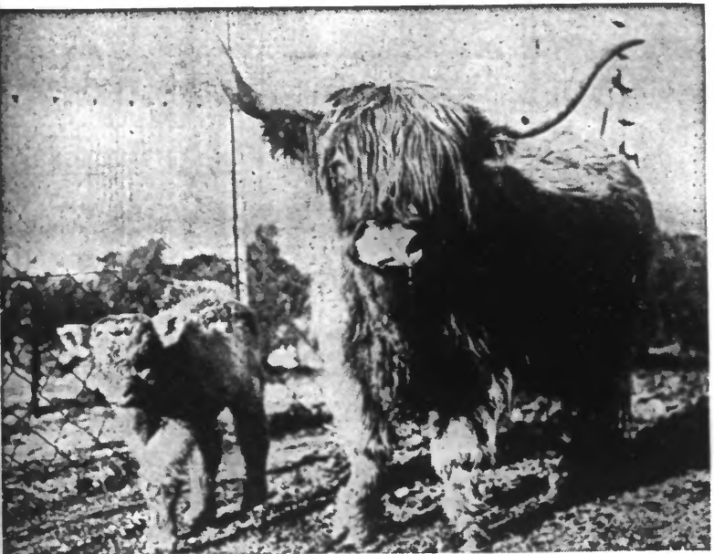
N'est-il pas charmant ce jeune veau frisé, âgé seulement de quatre jours, aux côtés de sa mère, une magnifique vache d'Ecosse à poils longs ?