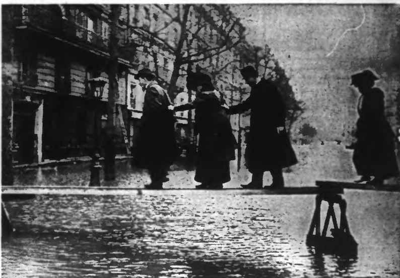
SOUVENIRS DES INONDATIONS DE 1910, A PARIS